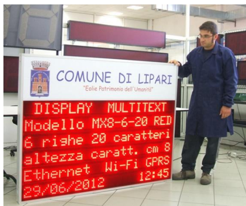
Esempio di tabellone a led per informazioni ai cittadini con programmazione wireless da remoto